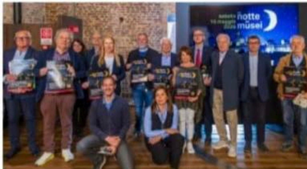
La conferenza stampa con i rappresentanti dei Musei

Il primo evento sinergico della Rete che riunisce le istituzioni culturali e i monumenti